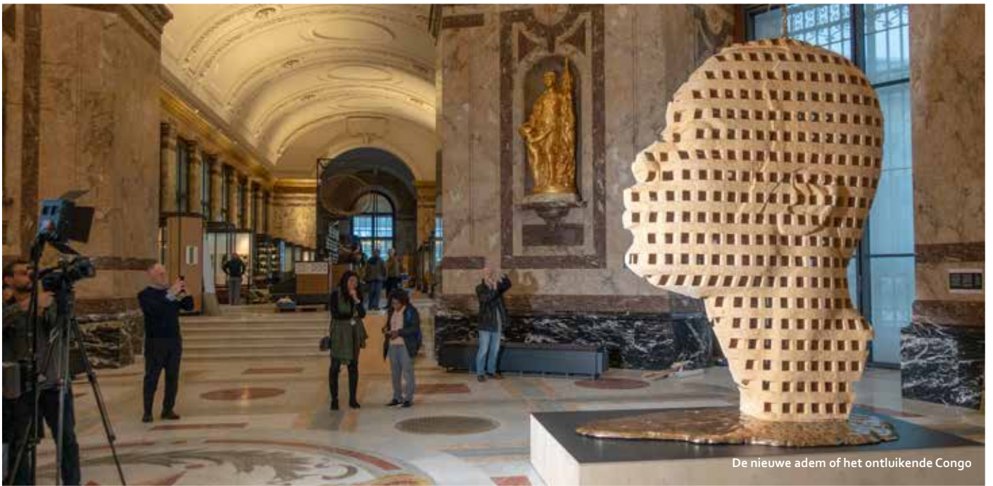
De nieuwe adem of het ontluikende Congo